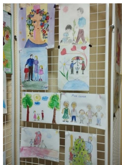
Оформление стенда – рисунки на тему «Семья»