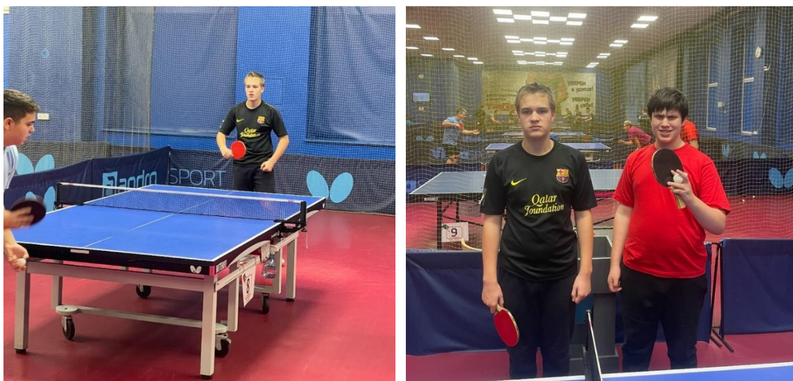
Спортивное мероприятие Спортфест 19.11.2024.