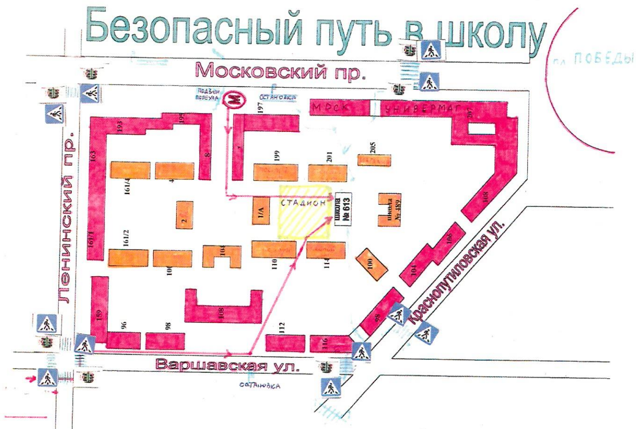
Схема организации дорожного движения в непосредственной близости от образовательного учреждения с размещением соответствующих технических средств, маршруты движения детей и расположение парковочных мест